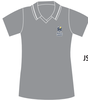
JSY-01-PML Polo fille Manches courtes (Jersey poly-coton 65/35) 16,50 $

UNIFORMES SCOLAIRES de fabrication 100 % québécoise