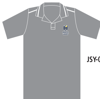
JSY-03-PML Polo garçon Manches courtes (Jersey poly-coton 65/35) 16,50 $