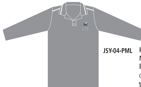
JSY-04-PML Polo garçon Manches longues (Jersey poly-coton 65/35) 17,50 $