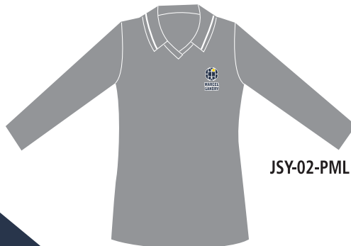
JSY-02-PML Polo fille Manches longues (Jersey poly-coton 65/35) 17,50 $