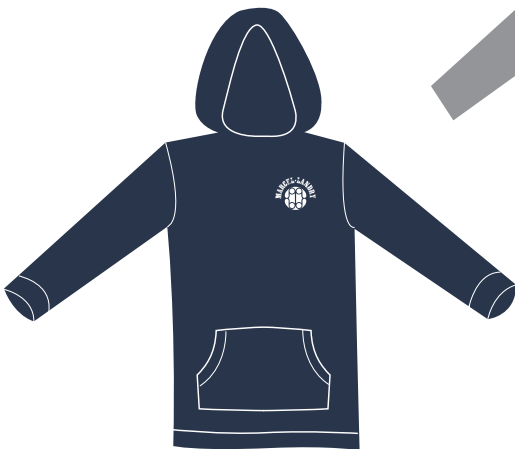
ADL-10-PML Kangourou unisexe capuchon et poche (coton ouaté 65/35) 26,00 $